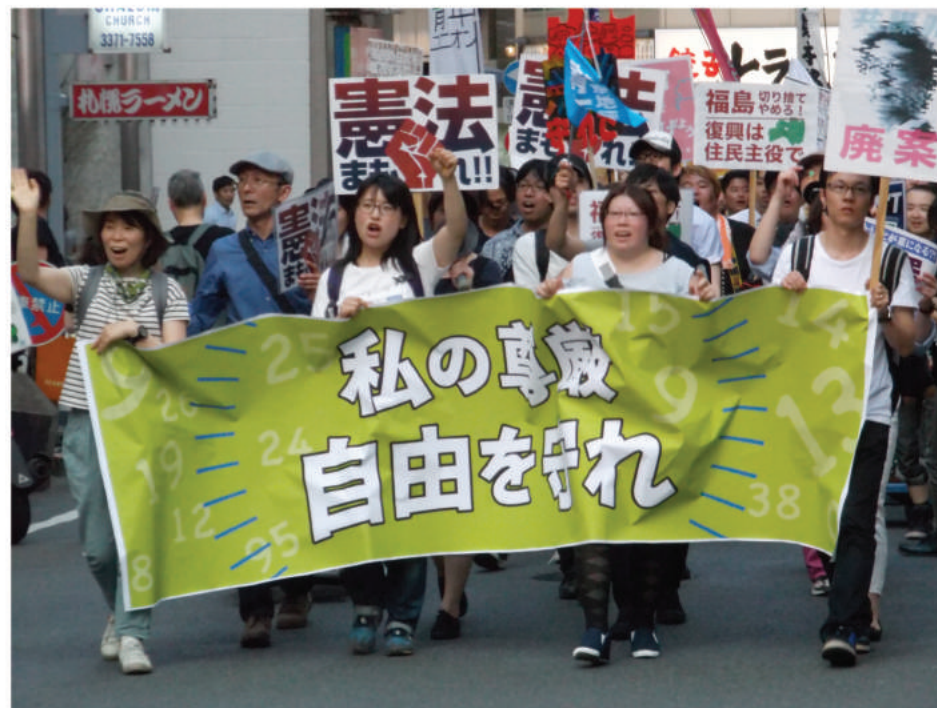
5.21 若者憲法集会で「憲法を変えるな 政治を変えろ」とパレード