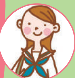
高校3年生の あいねさん（17）

安倍首相がひどいことも言っても『あーまたか』と慣らされては危ない。野党は共闘をすすめています。重要なことは、私たち国民がユナイト（団結）あることだ。